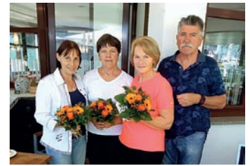
Ein Dankeschön an unsere Vorturnerinnen