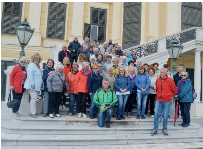
Schloss Schönbrunn mit Heurigenbesuch