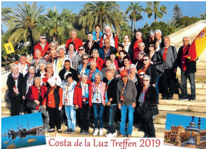
Frühlingstreffen des Pensionistenverbandes

Erlebnisse sind am schönsten, wenn man Sie mit anderen teilt!