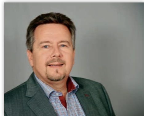
Ing. Peter Mair Bürgermeister

Ich möchte mich für Ihre Unterstützung bei der EU Wahl am 27. Mai 2019 bedanken, die als Ergebnis für die Sozialdemokratie in Pasching eine kleine Steigerung brachte.