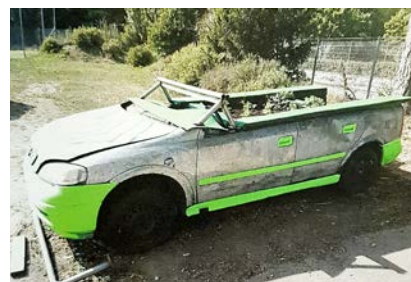
Das zum Hochbeet umfunktionierte „Chillout-Mobil“