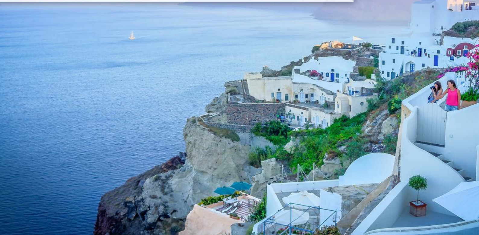
Foto: Griechenland Oia • Pixabay License • miramichelle (Instagram)

Die SPÖ Pasching wünscht Ihnen und Ihren Lieben erholsame Tage und belebende Begegnungen!